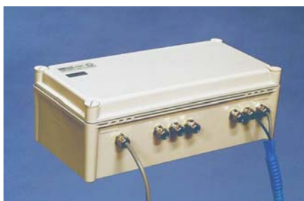
Matning utanför zon. RS232 [EEx ib] IIC T4 Reläer