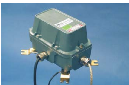
230VAC matning i zon. EExd [ib] IIB T6