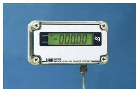
Slavdisplay i zon. EEx ib IIC T4