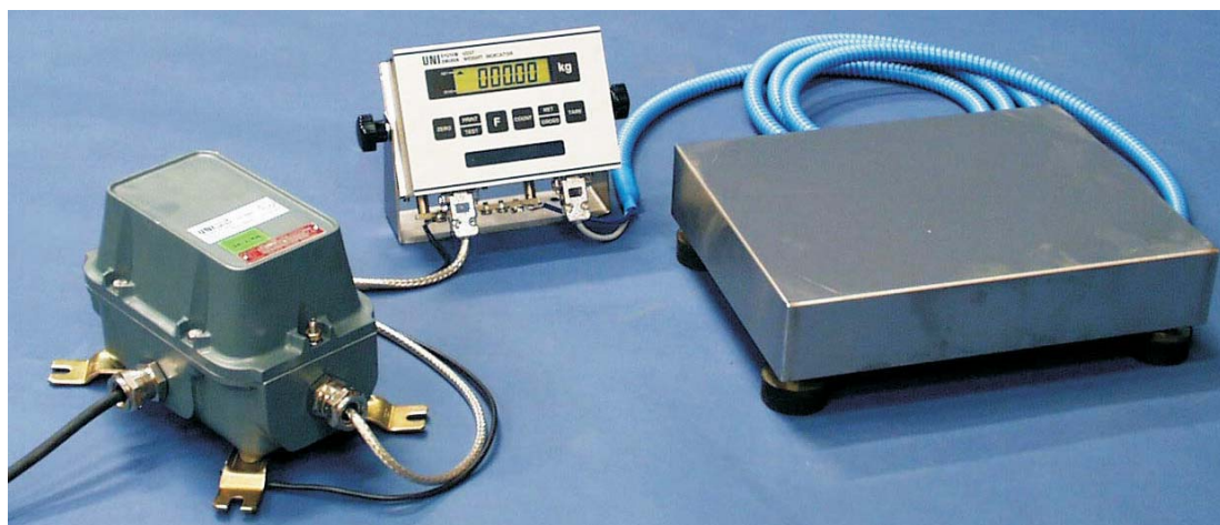
Bilden visar 230VAC-matning, indikator och paketvåg.