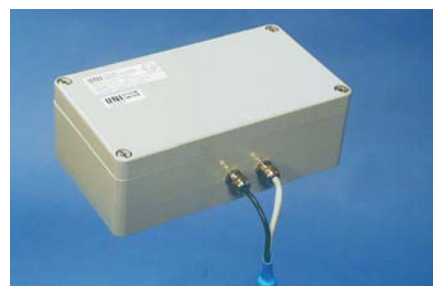
Batterimatning. Laddas utanför zon. EEx e [ib] IIC T4